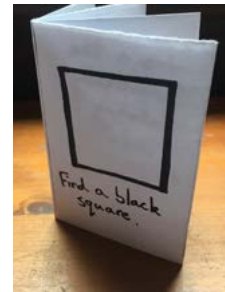
Tudalen 11: 'Semantically Satiating Dada' gan Luke 'Luca' Cockayne