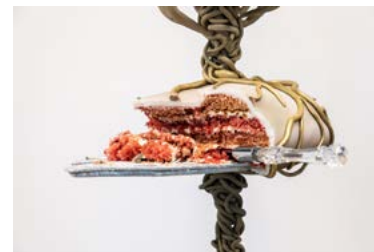
Tudalen 15: 'Let them eat cake' gan Caroline Cardus